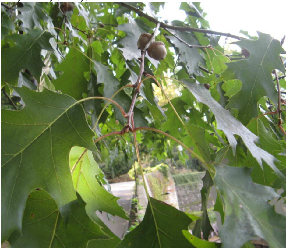
číška s nažkou

Plody – nažky (žaludy) sedící ve zdřevnatělé číšce